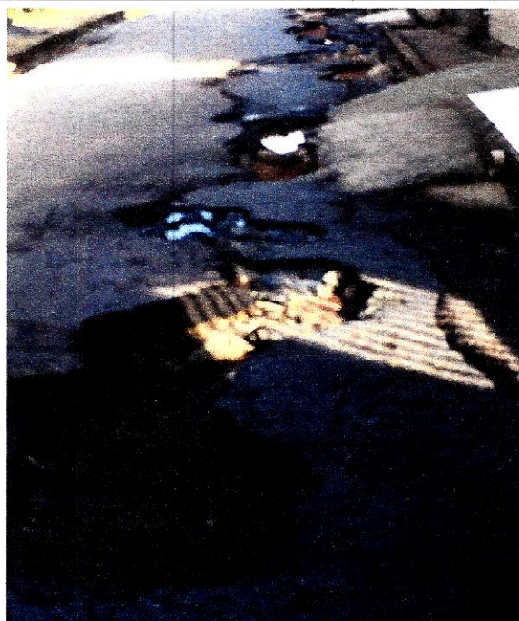
RUA RAUL OLEGÁRIO – BAIRRO CATETE